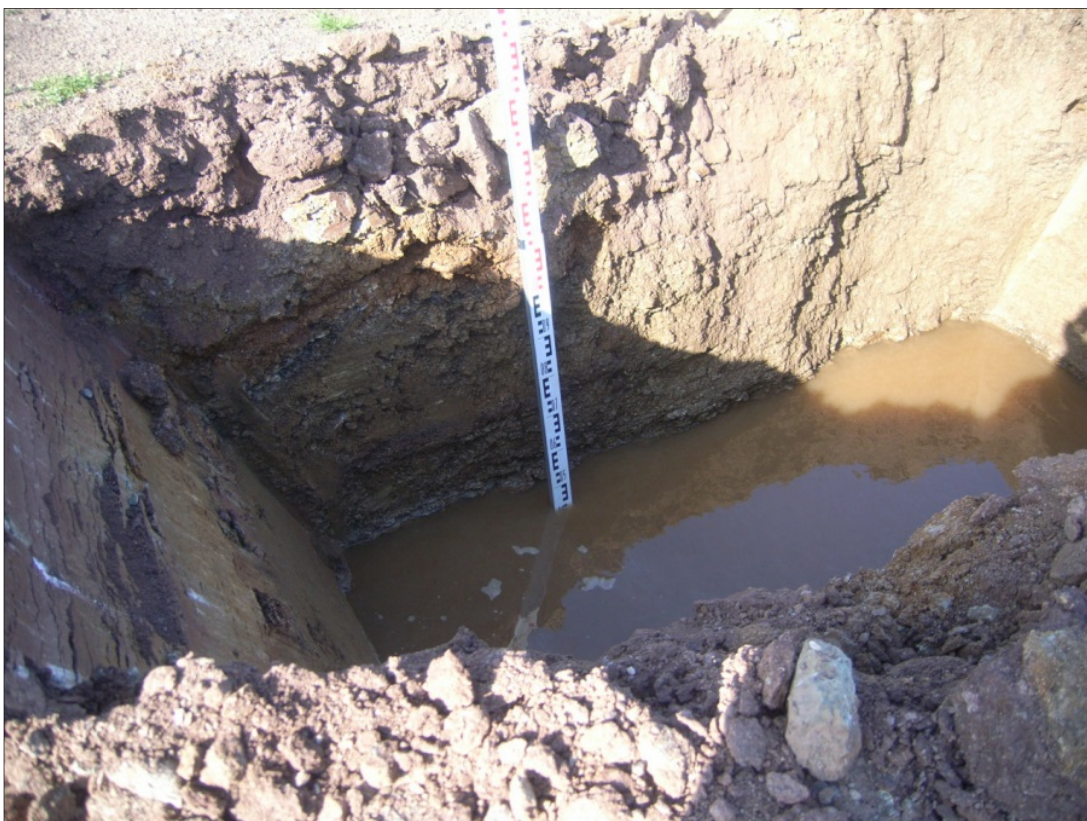
Bild 4: Durchführung Sickerversuch, Messung der Wasserstandsabsenkung